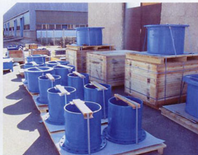
Fővárosi Vízművek Rt. KEULAHÜTTE csapózárak és idomok szállítása