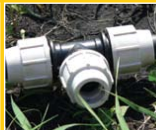
PLASSON mechanikus gyorskötők szerelése: gyorsan – könnyen – egyszerűen – szerszám nélkül