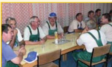
Díjátadás oldott hangulatban