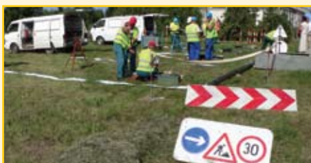
Az „éles” helyzetekben minden külső körülményre oda kell figyelni (forgalomterelés – láthatósági mellény – egyéni munkavédelmi felszerelések)