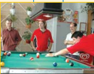
A biliárd is igen népszerű volt