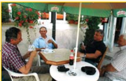
Magyarország nemzeti sportja az ulti