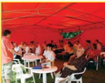
Bemelegítésként rövid „szakmai eligazítás” a résztvevők számára

Ezek biztosítják azt a népszerűséget, melynek köszönhetően idén nyáron immár negyedik alkalommal került lebonyolításra az Északdunántúli Vízmű Zrt. és az Euroflow Zrt. közös rendezésében a sportnap, gyönyörű környezetben, a tatai edzőtáborban. A jó hangulathoz minden adott volt: versenyzőinket kegyeibe fogadta az időjárás, valamint a kitűnő ételeken és italokon túl a szervezők mindenre kiterjedő figyelmes munkája volt az, mely mindenki számára feledhetetlenné tette e délutánt. Természetesen a nemes küzdelem jutalma sem maradhatott el: a nyertesek értékes ajándékokat kaptak. Képriportunk a verseny legfontosabb pillanatait mutatja: