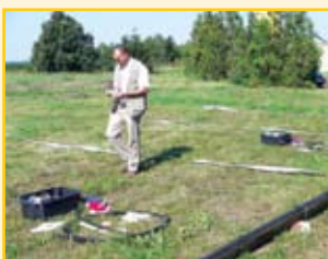
A szervezők által végzett gondos előkészítés = a siker garanciája