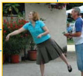
Darts = kecses mozdulat + pontos célzás