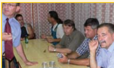
A „szigorú, de igazságos” zsűri, a TRV vezérkara