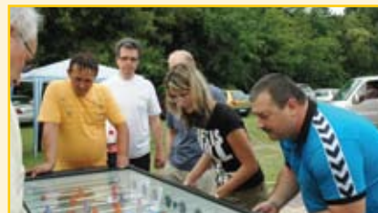
Ha az „igazi” fociban még nem is, de csocsóban már mindenképpen a világ élvonalában vagyunk