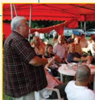
Az esemény zárása: összefoglalás – értékelés