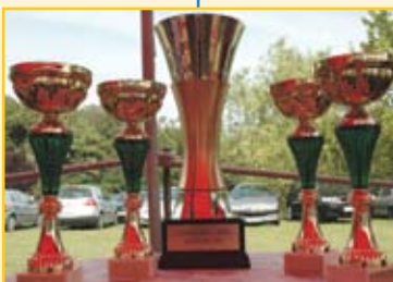
A serlegek és a vándorkupa – még átadás előtt, leendő tulajdonosaikra várva