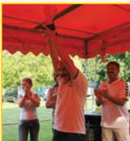
A vándorkupa átadása