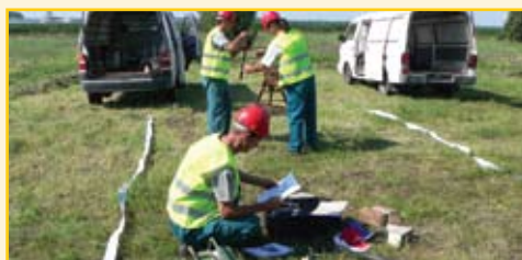
A feladat akkor oldható meg tökéletesen, ha előtte minden apró részletre kiterjed a versenyzők figyelme