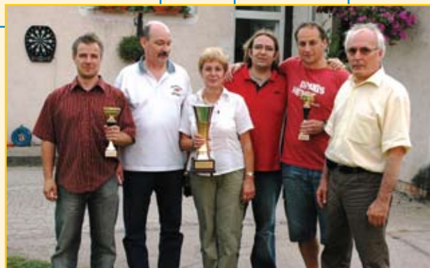
A győztes csapat

Köszönetünket fejezzük ki az ÉDV Zrt minden kollégájának az esemény hibátlan lebonyolításában nyújtott segítségéért