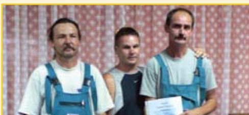
A győztes záhonyi csapat, akik győzelmükkel jogosultságot szereztek a TRV képviseletére a Magyar Víziközmű Szövetség által szervezett Országos Szerelőversenyen, idén októberben, Zalakaroson

Köszönetünket fejezzük ki az TRV Zrt minden kollégájának a Szerelőverseny lebonyolításában nyújtott segítségéért