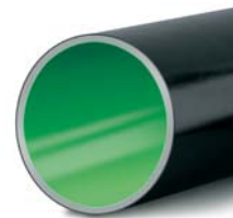
„A különleges bevonatok különleges tulajdonságokkal ruházzák fel a vonRoll csöveket”

Az Euroflow Zrt beszállítóinak másik nagy csoportját azok a gyártók adják, melyek csak az utóbbi egy-két évben kerültek be a fent részletezett „hagyományos” partneri körbe, de a 2007. év folyamán már teljes létjogosultságot szereztek és minősített beszállítóivá váltak cégünknek.