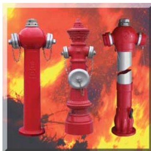
„Német precizitás és innováció minden tekintetben: KEULAHÜTTE tűzcsapok, öntvény idomok és szerelvények”