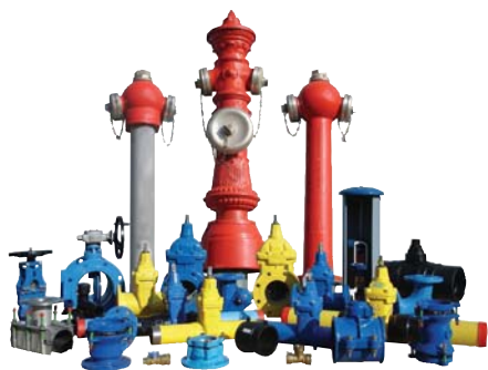
„AVK szerelvény – termékcsalád a vízépítési igények teljes körű kielégítésére”

Vannak az Euroflow Zrt beszállítói között olyan gyártók, melyek termékei kezdetektől fogva meghatározó szerepet játszottak a cég életében. Ezt a hírnevet a termék műszaki színvonala, a korszerű gyártástechnológiával párosuló precizitás és szakértelem, a gyártói alapfilozófia iránti töretlen elkötelezettség alapozta meg. E „hagyományos” beszállítói kör tagjai a dán AVK (csőszerelvények, csőhálózat-építő anyagok), a német KEULAHÜTTE gömbgrafitos öntvény idomok, szerelvények, valamint tűzcsap-család, és a svájci vonRoll cég poliuretán-bevonatos gömbgrafitos öntöttvas DUCPUR / ECOPUR / GEOPUR csövei.