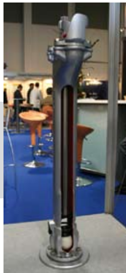
Biztonságosan a föld alatt is...