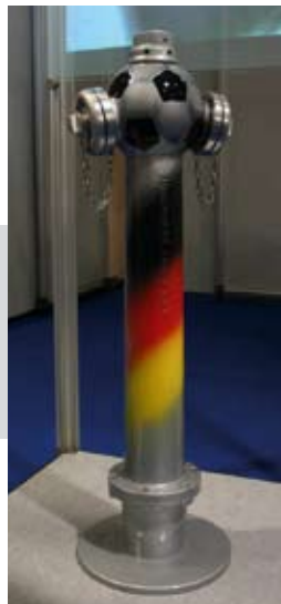
„A foci VB tűzcsapja”